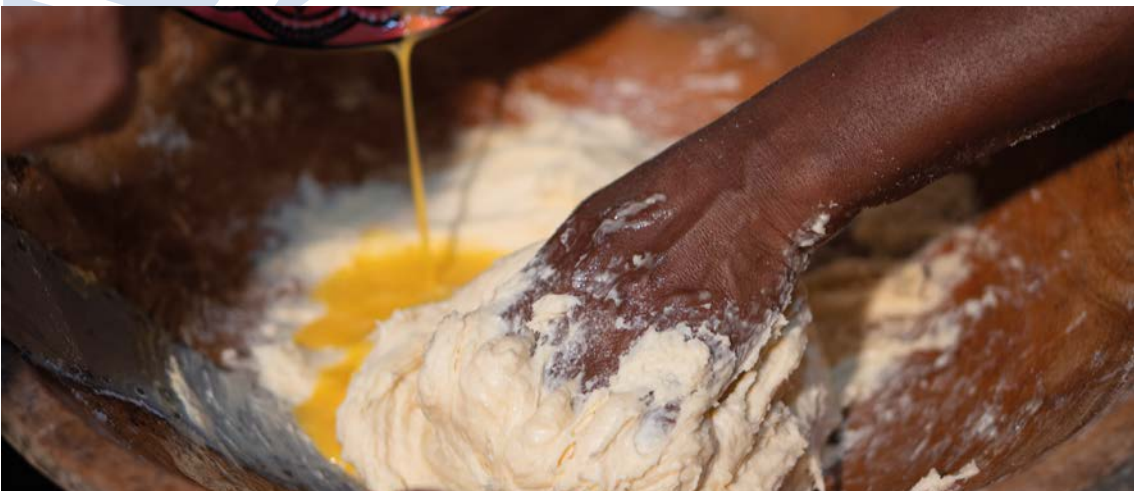
Preparo de uma receita.