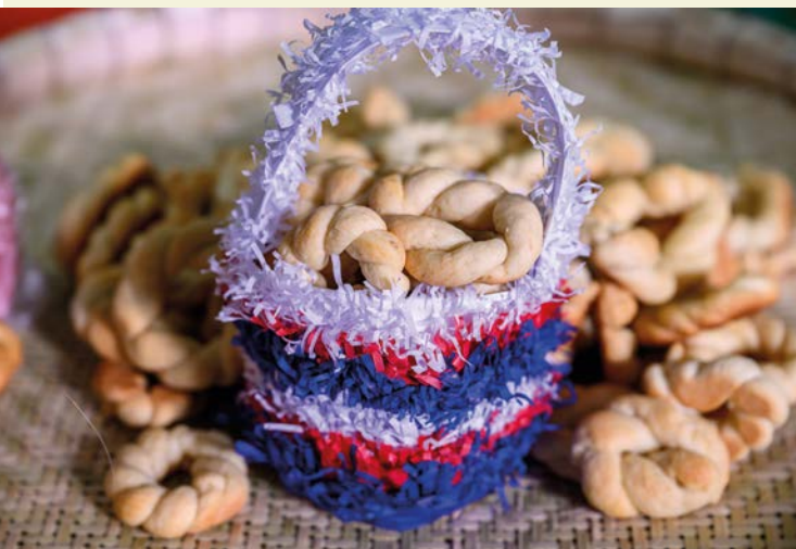
As cestinhas de quitandas da Festa do Rosário.

sas ocasiões, a forma de apresentação ganha destaque, com as quitandas dispostas em cestinhas decoradas, o que facilita a distribuição ao longo das celebrações. Outro aspecto característico desses momentos refere-se ao tamanho das quitandas. Em contextos festivos, são feitas em proporções menores do que o habitual, o que favorece a partilha durante os encontros.