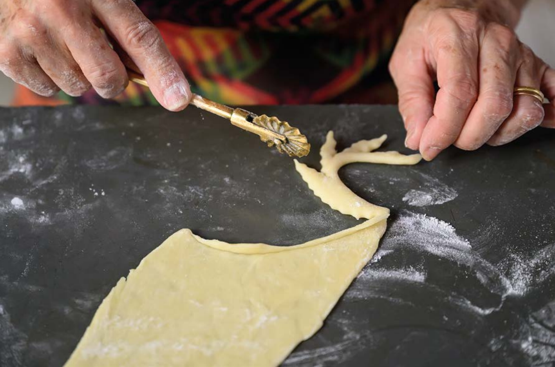
Modelação das Cavacas.