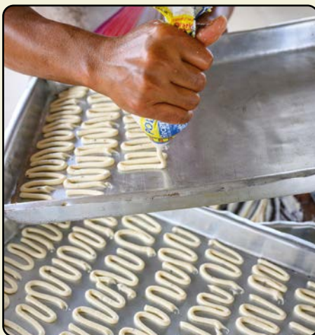
Modelagem do biscoito escrevido.

Colocar a goma em uma gamela ou bacia. Acrescentar o sal, a água fria, o óleo frio e o leite (a inserção do leite é opcional em algumas receitas). Misturar bem. Colocar no fogo um copo de água e um copo de óleo e deixar ferver. Escaldar a goma com a mistura fervente. Misturar novamente até ficar uniforme. Acrescentar os ovos e amassar a massa, sovando bem. Observar a textura para verificar se é possível espremer. Se a massa estiver dura, acrescentar mais ovos ou um pouco de água. Continuar sovando até atingir o ponto de escrever o biscoito.