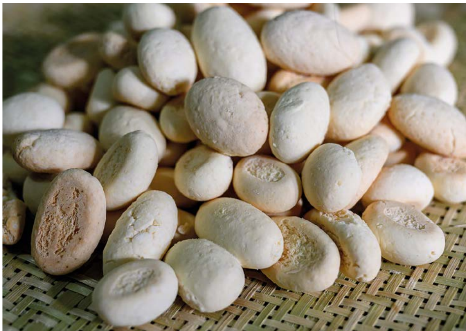
Biscoito de coco.

Resultado esperado: Espera-se que os alunos reconheçam os Modos de Fazer Quitandas como parte do patrimônio cultural local, identifiquem sua presença no cotidiano das famílias e compreendam as formas de transmissão desses saberes. A atividade também contribui para fortalecer o vínculo entre escola, comunidade e território, valorizando as pessoas que mantêm essas práticas.