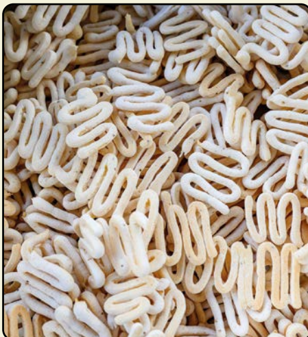
O biscoito escrevido assado.