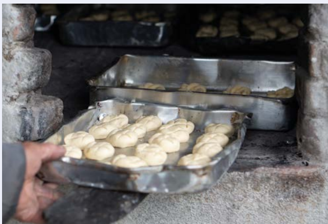
Quitandas no forno a lenha.

Essa trajetória foi construída pela presença e pela interação de diferentes grupos sociais. Populações indígenas,