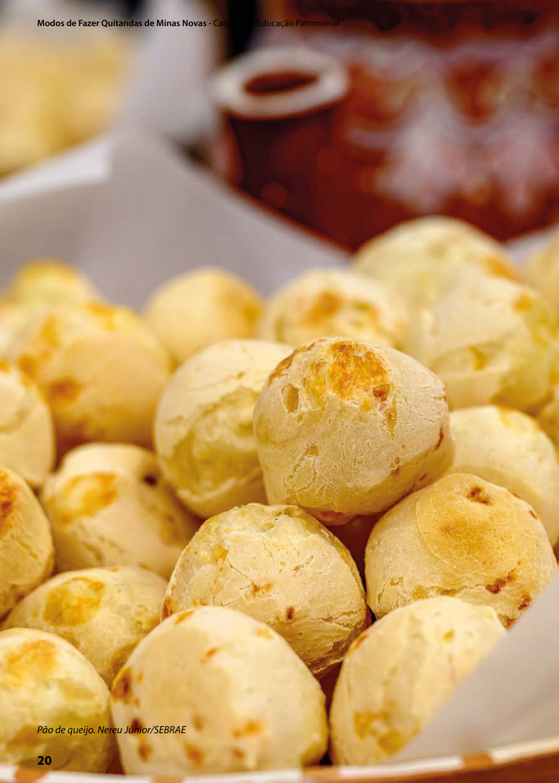
Pão de queijo.