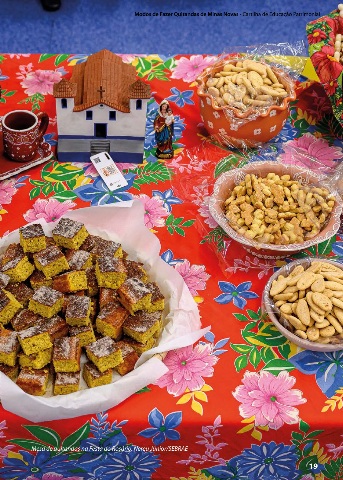
Mesa de quitandas na Festa do Rosário.